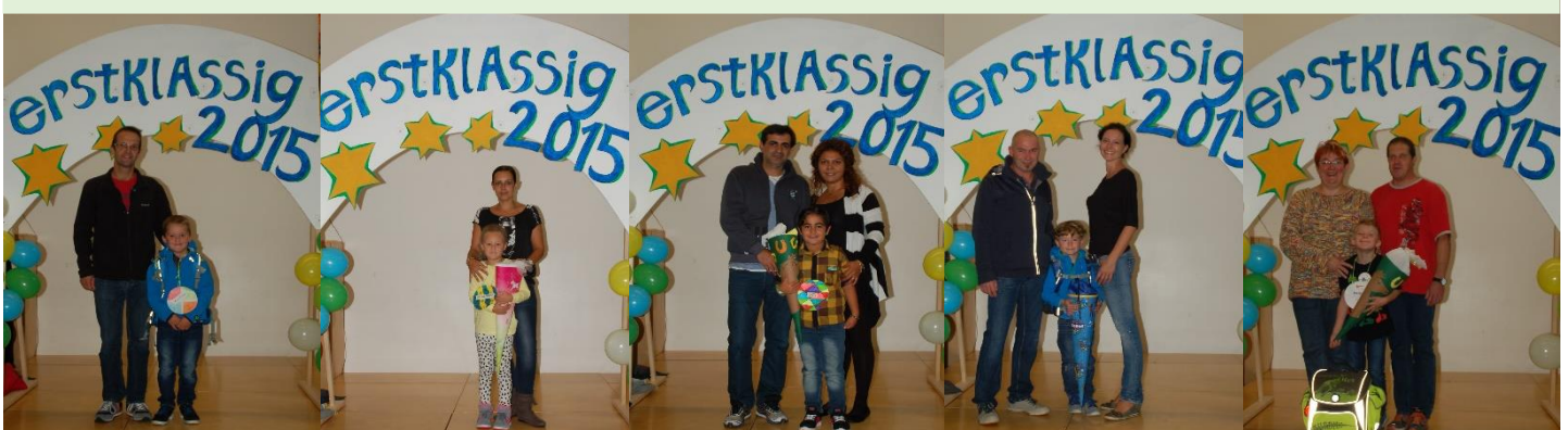
Hier ein paar Bilder unserer erstklassigen Tafelklässler!